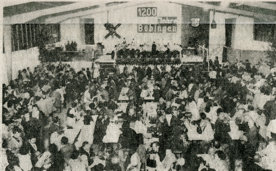
Bis auf den letzten Platz gefüllt war die Festhalle, als Böbingen seine Feierlichkeiten anlässlich der 1200-Jahr-Feier am Freitagabend eröffnete.